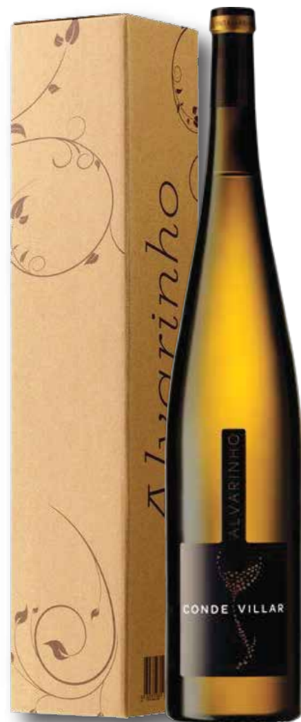
Ref. 341 Conde Villar Alvarinho 1,5L