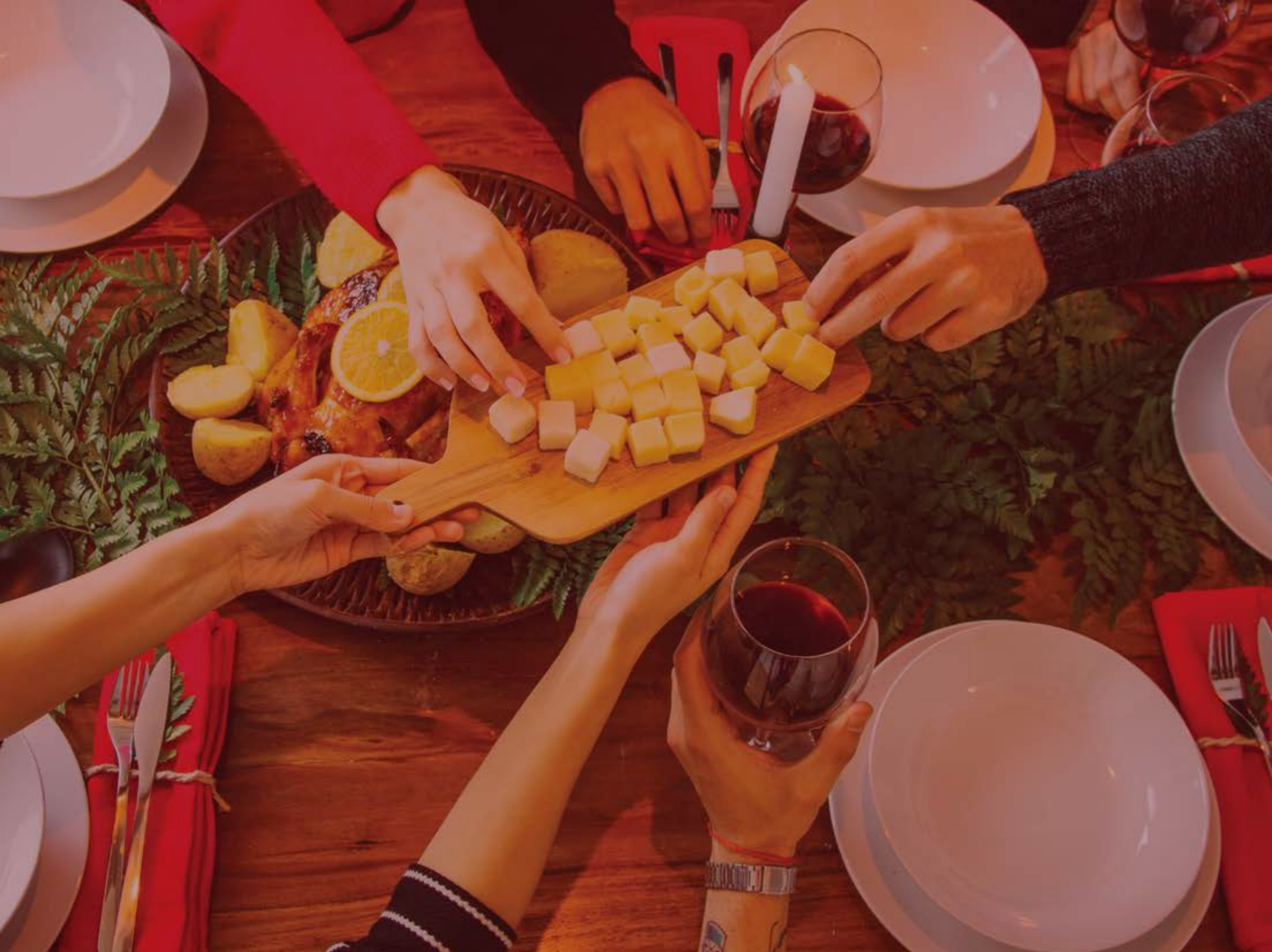
Ref. 410 Plateau à fromage