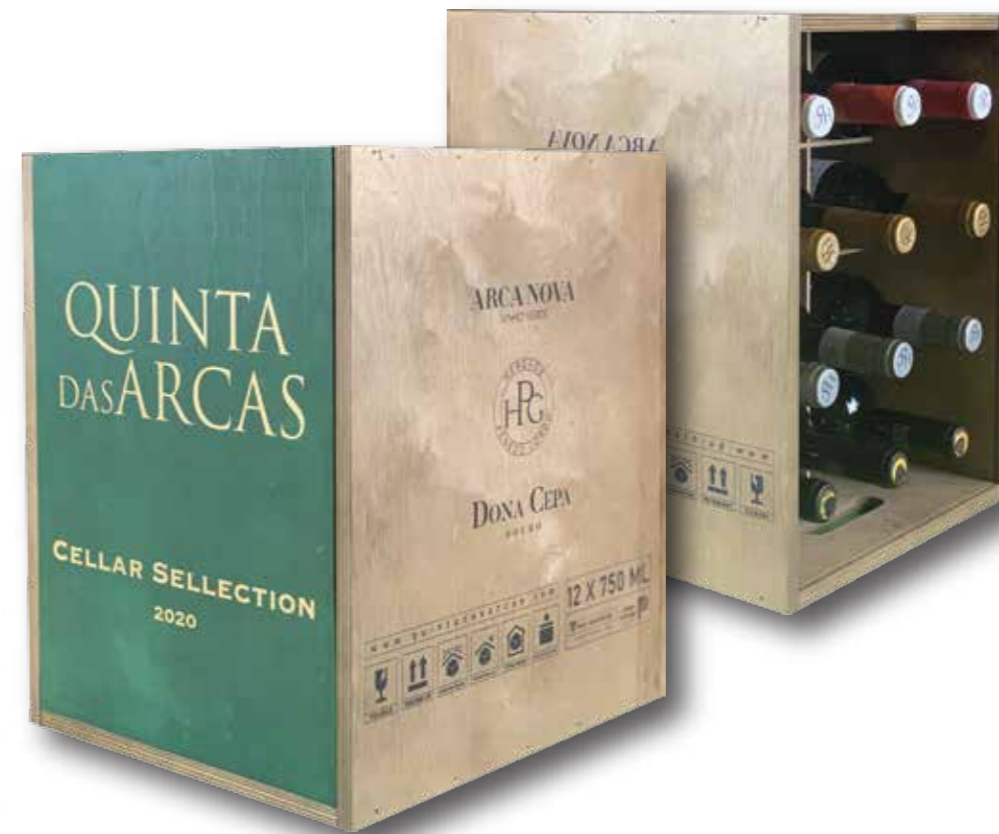
Ref. 409 Cave à vin Quinta das Arcas 12 bouteilles 0.75 ml