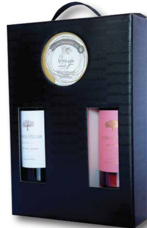
Ref. 307 Coffret en carton 2 bouteilles de Vinho Alentejo ou Vinho Verde et 1 fromage