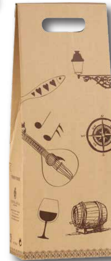
Ref. 330 Boîte 2 Bouteilles Portugal Sélection 2 bouteilles Vinho Verde ou 2 bouteilles Vinho Alentejo